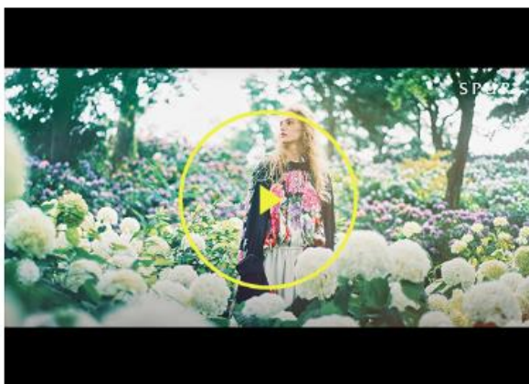
SPUR SHOES IN DREAMLAND シューズが奏でるファンタジア