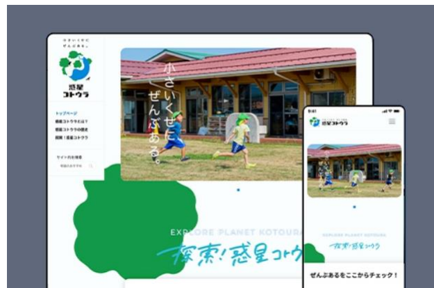
鳥取県琴浦町「惑星コトウラ」など