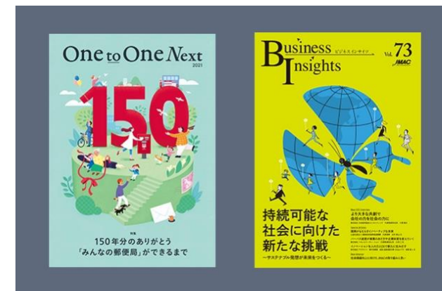
日本郵便株式会社、 日本能率協会コンサルティングなど