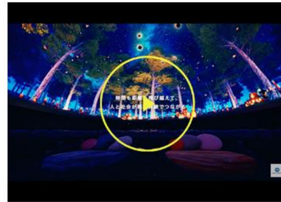
コニカミノルタプラネタリウム 周年記念映像