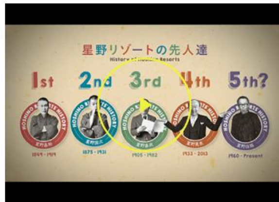
星野リゾート 歴史のご紹介